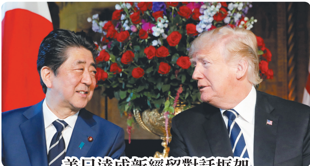
美日達成新經貿對話框架

然而，此類基金在跌市時的抗跌性普遍不強，而在升市時的升幅亦未必會更高。因此，對於擁有基金投資經驗的人士而言，不妨考慮借助過往表現優異的股票和債券基金進行相應資產配置，以建立一個能讓風險及自身投資取向相平衡的組合。